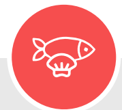
Marisco y crustáceos